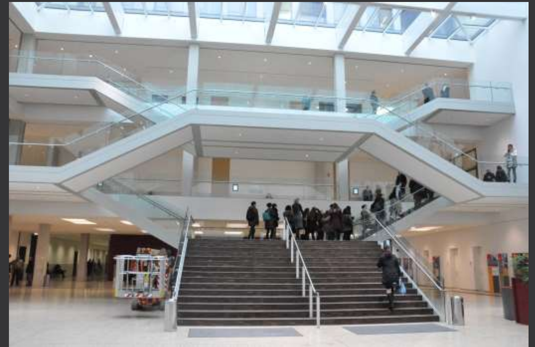
Cour d'Appel de Düsseldorf (Landesgericht)