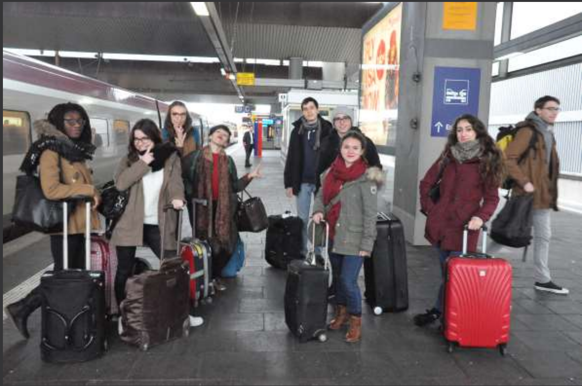
Arrivée à Düsseldorf pour une partie du groupe.