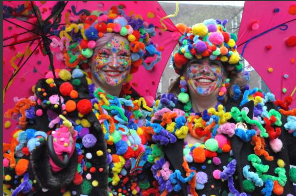
Première balade en ville: deux femmes une semaine avant le carnaval