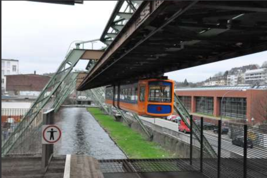
Le tramway suspendu