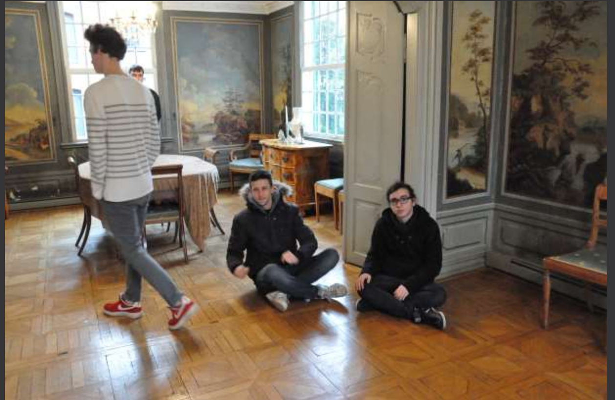
Visite du Musée de l'industrie minière et de la maison natale de Friedrich Engels